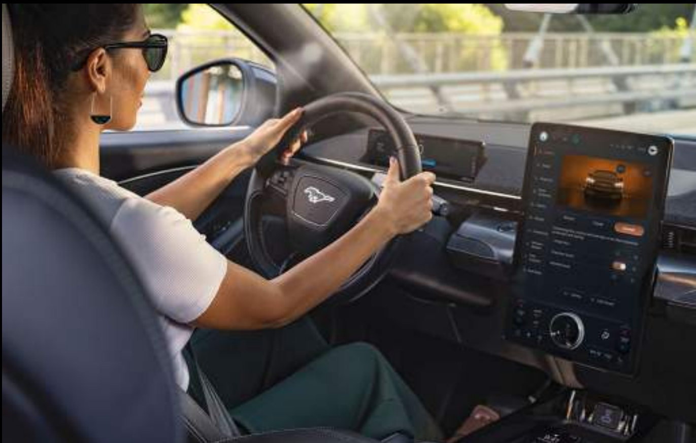
Ford Mustang MACH-E® w wersji GT z opcjonalnym wyposażeniem

System Ford SYNC 4A reaguje błyskawicznie na dotyk, gest i polecenia głosowe, oferując inteligentne sterowanie wszystkimi funkcjami pojazdu. Bezprzewodowe Apple CarPlay™, Android Auto™ oraz ładowarka indukcyjna gwarantują pełną łączność i płynność działania, na miarę elektrycznego Mustanga.