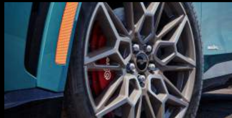
20" obręcze kół Wyposażenie standardowe wersji GT