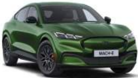
ERUPTION GREEN - lakier metalizowany 5 500 zł