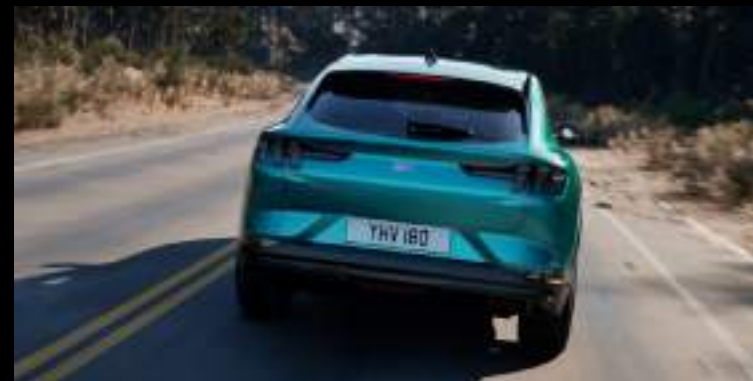
Tylne światła w technologii LED Wyposażenie standardowe wszystkich wersji