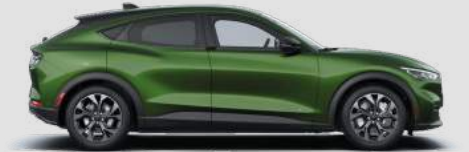
Długość całkowita wersji MACH-E i Premium 4713 mm

Pomiar zgodnie z normą ISO 3832. Rzeczywiste wymiary mogą się różnić od podanych wartości w zależności od wersji i wyposażenia. Wszystkie podane wyżej wartości są danymi fabrycznymi.