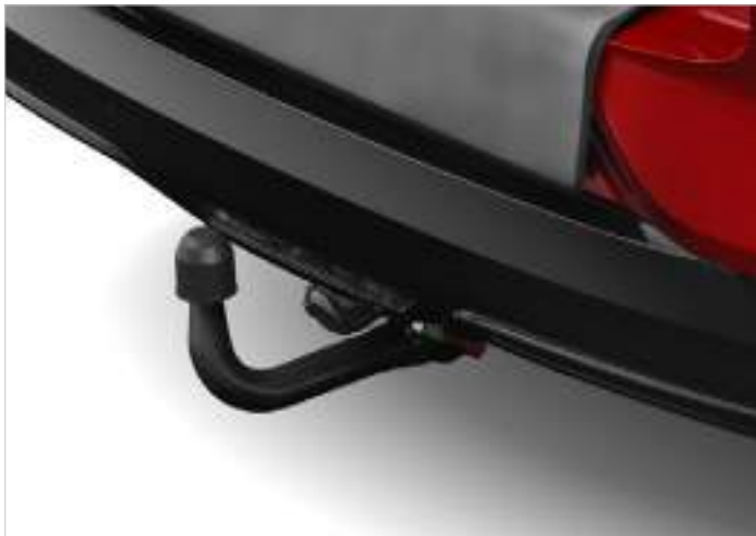
Hak holowniczy - odłączany (2 616 493) 3 026 zł