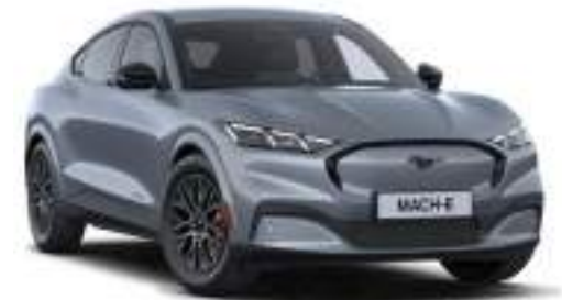
GLACIER GREY - lakier metalizowany specjalny 5 500 zł