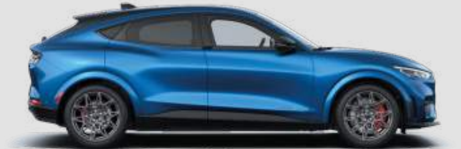
Długość całkowita wersji GT 4743 - 4749 mm