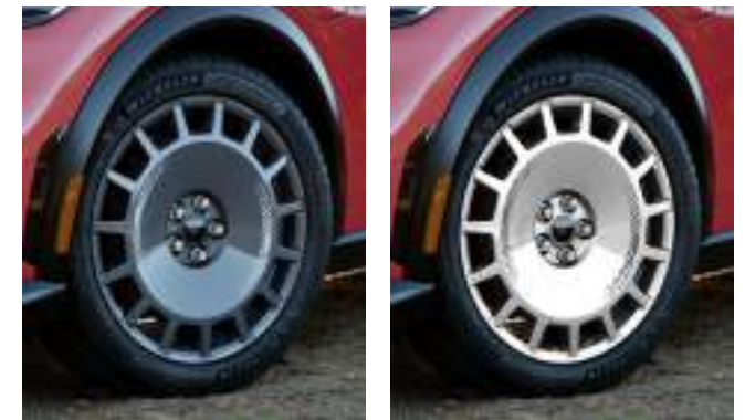
19" obręcze kół ze stopów lekkich w stylistyce rajdowej Ciemne (standard), jasne - wymagają dopłaty 1 600 zł