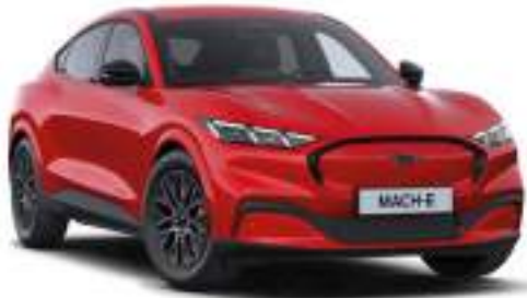
RACE RED - lakier specjalny bez dopłaty