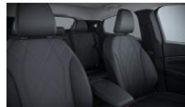
Ford Mustang Mach-E® w wersji Mach-E w kolorze Race Red (bez dopłaty) Wnętrze: Tapicerka skórzana - skóra ekologiczna (wyposażenie standardowe)