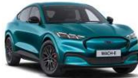
ADRIATIC BLUE - lakier metalizowany 5 500 zł