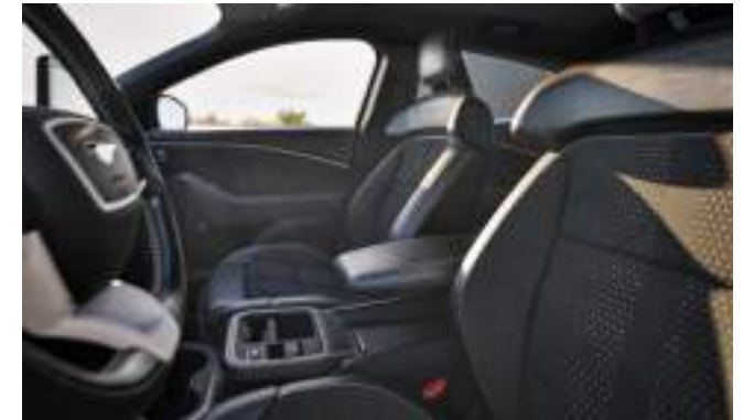
Fotele Ford Performance z wykończeniem w kolorze Silver City Wyposażenie standardowe pakietu Rally

Pakiet niedostępny z opcją dachu panoramicznego.