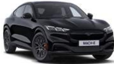
ABSOLUTE BLACK - lakier specjalny 4 000 zł