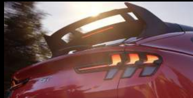
Duży tylny spoiler