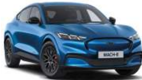
VELOCITY BLUE - lakier metalizowany 5 500 zł