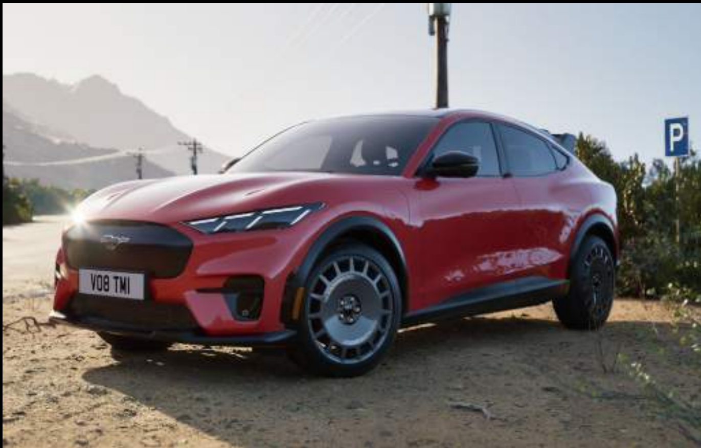
Ford Mustang Mach-E GT® z pakietem Rally

Pakiet dostępny w ograniczonej liczbie egzemplarzy w Europie. Pełna specyfikacja na stronie 11.