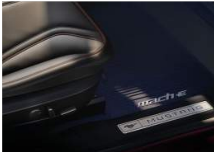
Dywaniki podłogowe, gumowe przód i tył, czarne (2 526 938) Komplet (4 sztuki) - 1 039 zł