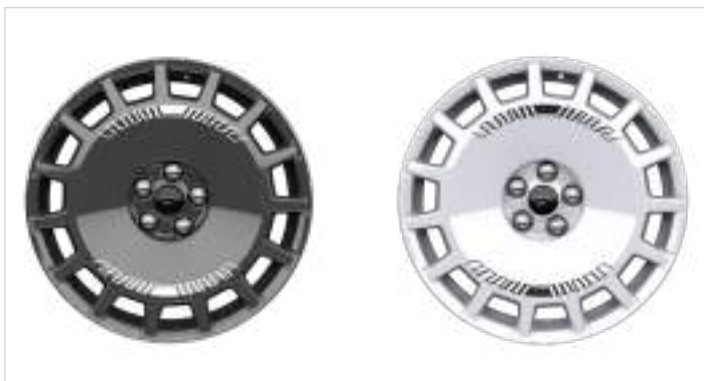
19" obręcze kół ze stopów lekkich w stylistyce rajdowej Pakiet Rally (ciemne w kolorze Carbonised Gray (D2VL2) - standard Przy wyborze białych obręczy (D2VL1) - dodatkowa dopłata do pakietu Rally: 1 600 zł