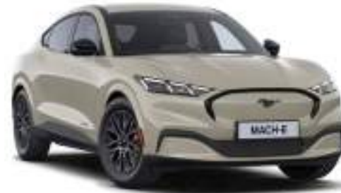
TERRAIN SAND - lakier specjalny 4 000 zł