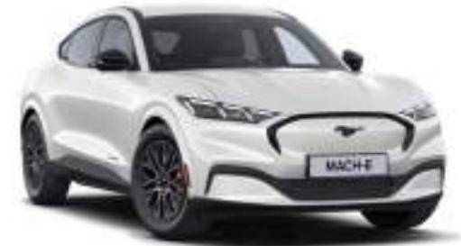
STAR WHITE - - lakier metalizowany specjalny 5 500 zł