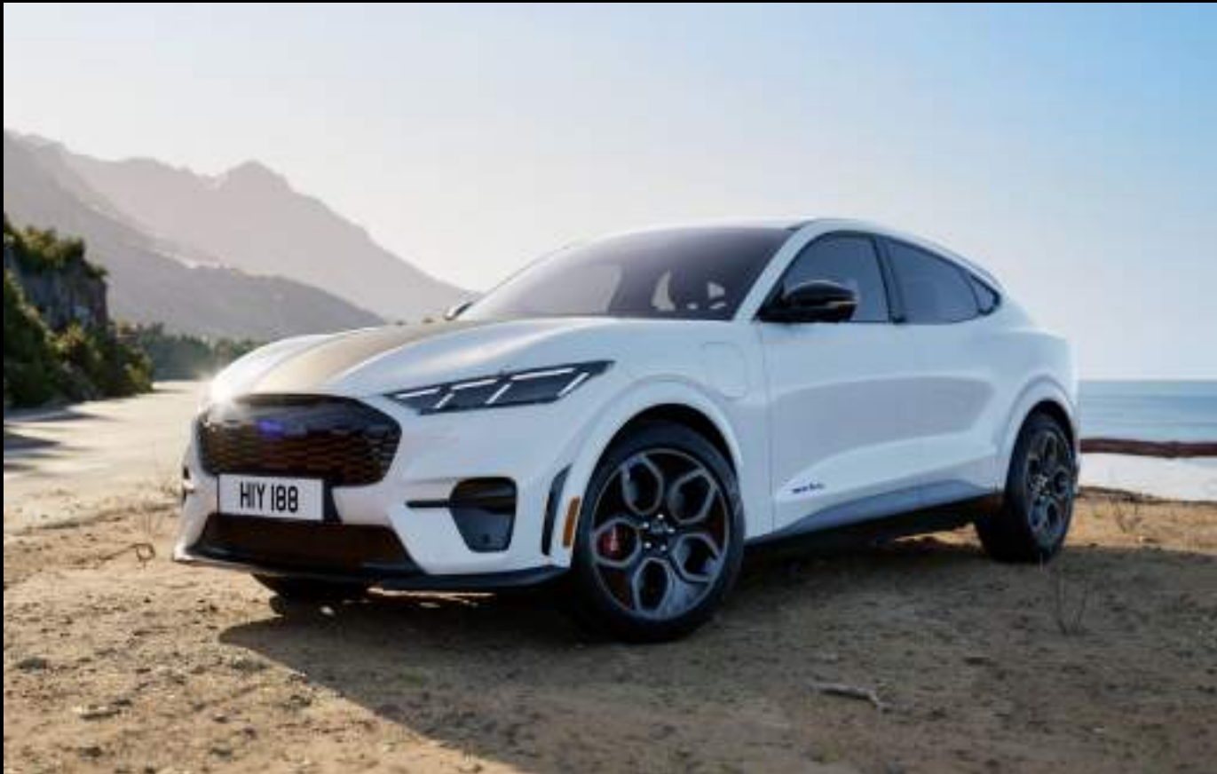
Ford Mustang Mach-E GT® z pakietem California Special