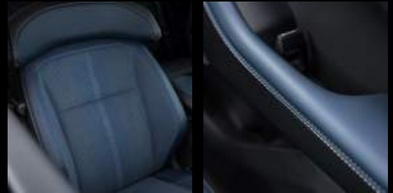
Unikalna tapicerka Mico Suede w kolorystyce Navy Pier Wyposażenie standardowe pakietu California Special