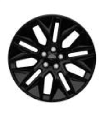
19" obręcze kół ze stopów lekkich (D2VCN) Opcja dla wersji Premium