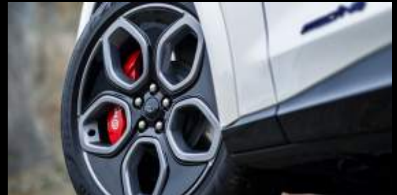
20"obrócze kół ze stopów lekkich Wyposażenie standardowe pakietu California Special