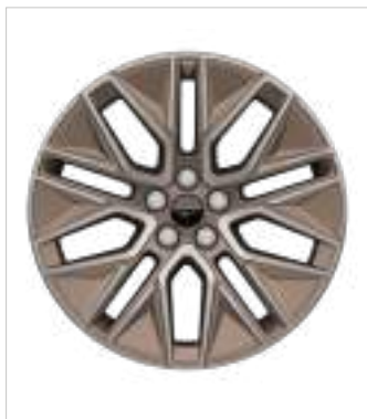
19" obręcze kół ze stopów lekkich (D2VCH) Opcja dla wersji Premium