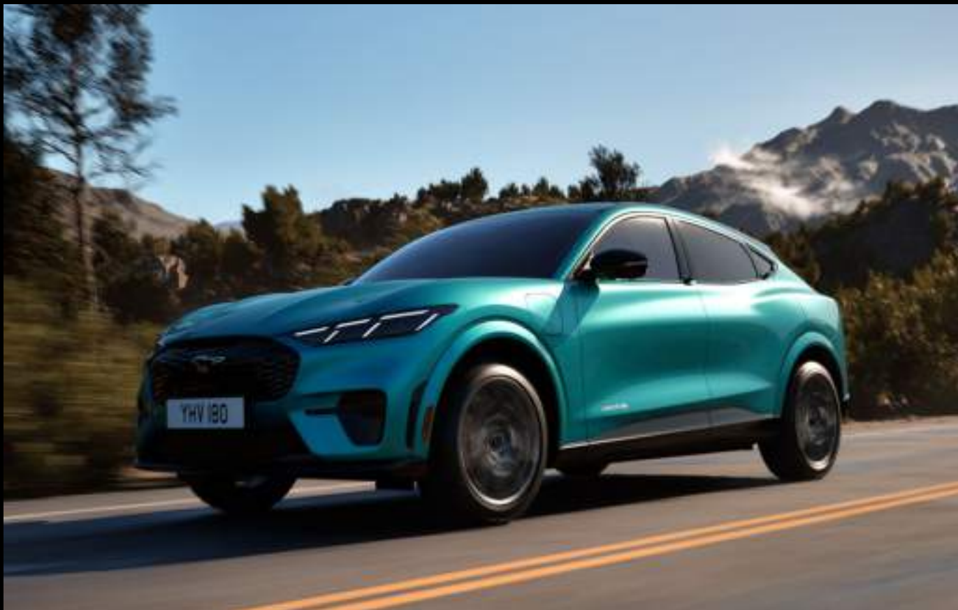
Ford Mustang Mach-E® w wersji GT. Kolor nadwozia: Adriatic Blue (opcja)

Mustang – manifest wolności. Inspirowany ponad 50-letnią historią Mustanga, Mach-E® łączy dziedzictwo legendy z nowoczesną technologią. Dynamiczna sylwetka, charakterystyczne tylne światła i muskularna maska przyciągają wzrok, a elektryczna moc zapewnia niezrównane wrażenia z jazdy. To SUV stworzony z myślą o kierowcach, którzy oczekują nie tylko mocy, ale też doskonałej precyzji prowadzenia.