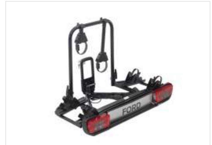
Uchwyt na dwa rowery Atera® - mocowany do haka holowniczego (2 756 542) 2 706 zł