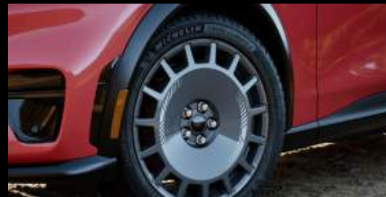
Felgi w stylizacji rajdowej (ciemne)